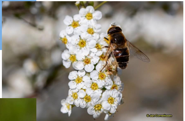
De blinde bij